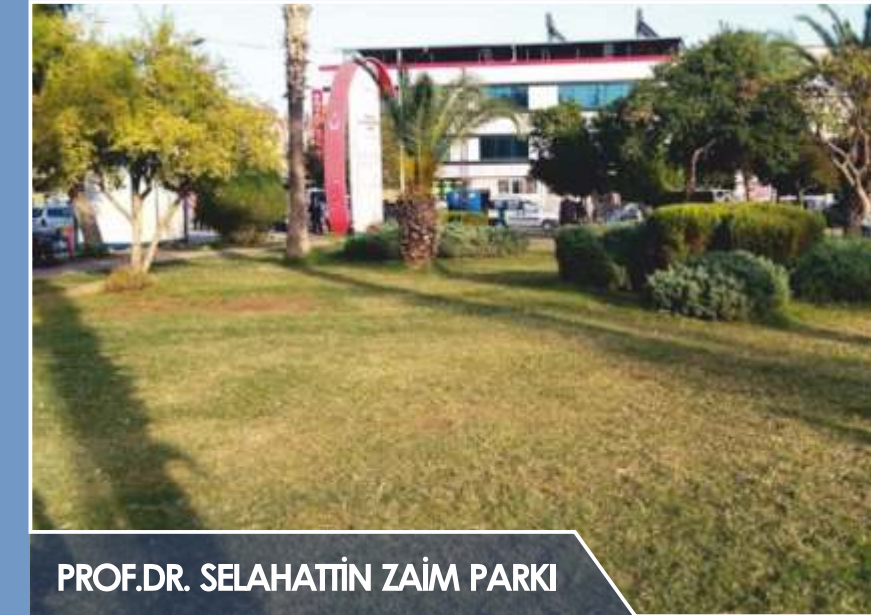
PROF.DR. SELAHATTİN ZAİM PARKI