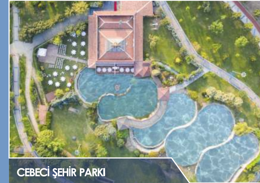
CEBECİ ŞEHİR PARKI